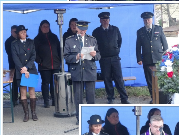
Požehnání pana faráře