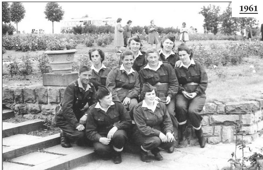
Výlet do Lidic