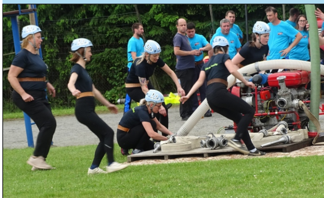
Požární útok žen starších