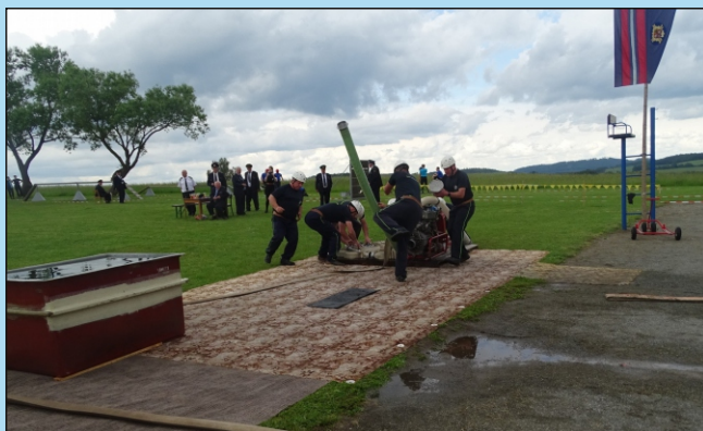
Požární útok mužů