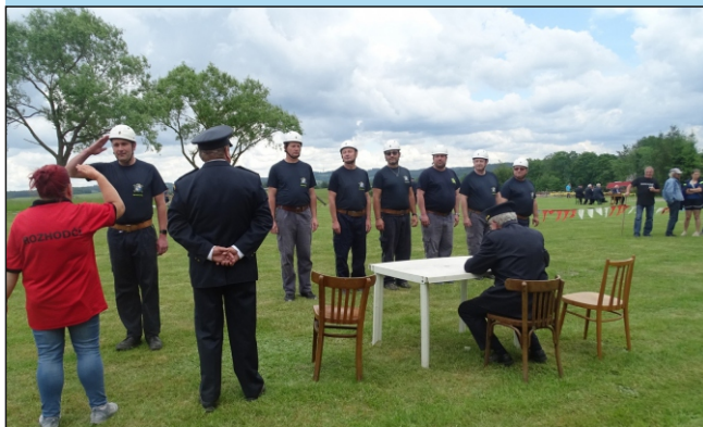
Pořadová příprava mužů starších