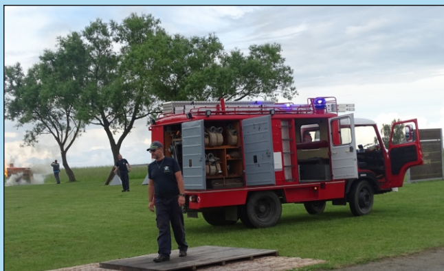
Petr Suchomel přivezl malé hasiče k hašení chaloupky