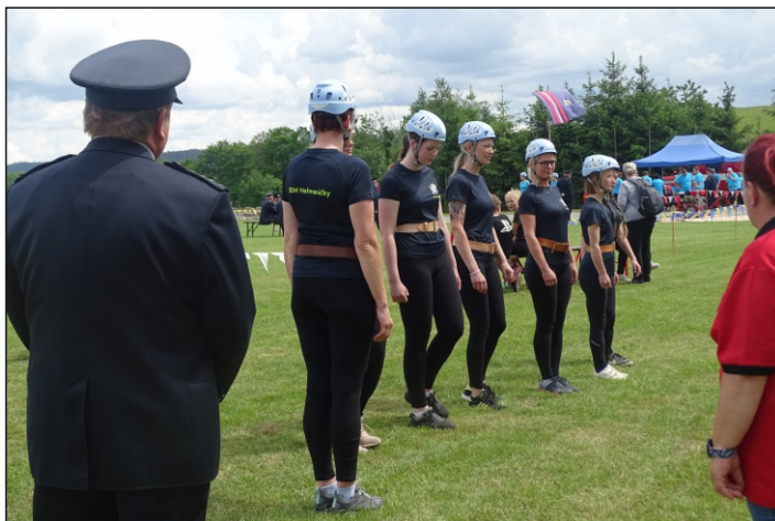
Pořadová příprava družstva starších žen z Heřmaniček