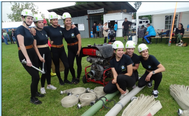
Příprava žen mladších na požární útok