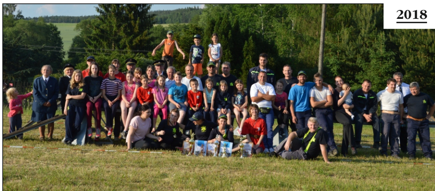
Okrsková soutěž Ješetice