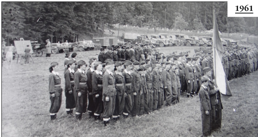
První okresní cvičení v Heřmaničkách na louce pod mlýnem Strašák. (Tenkrát ještě okres Votice)

Po založení požárního sboru v Heřmaničkách dne 24. 1. 1954 se všichni pustili s chutí do práce. Bylo ustanoveno družstvo mužů, které začalo s výcvikem pro potřebu zásahu proti požáru a pro účast v soutěži požárních družstev. K mužům se přidalo družstvo žen a družstvo žáků. Nejdříve se nacvičovalo s půjčeným náradím tak, že se sbory střídaly. Posléze Heřmaničky získaly stříkačku PPS-8 s vybavením a dále stříkačku DS-16. Technika se střídala za stále novější a tu starší postupovali menším sborům. Legendární hasičské vozidlo (ERENA) PRAGA RN, získaná od požárního útvaru Praha-Vršovice pro Heřmaničky je nyní v rekonstrukci. Jedná se již o historické vozidlo. Sbor nyní pracuje s hasičským vozidlem Avila 16 a to od roku 1988.